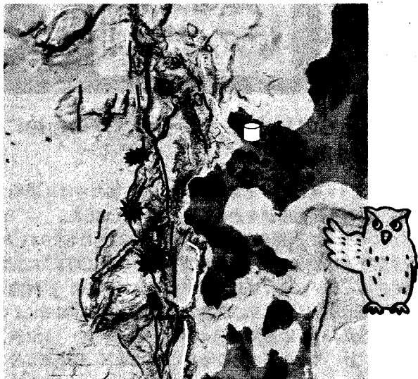
図2 泊原発沖の日本海底にみられる活断層 (中田ほか、2012を簡略化)