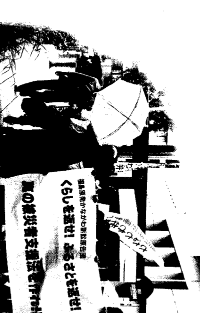
写真/2018年7月19日、支援者の集と拍手に送られて特審に拘い入廷するかなかわ訴訟原告団

https://sites.google.com/site/fukukakanaweb E-mail: fukukakana.shien@gmail.com