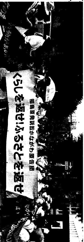
写真/2018年7月19日、支援者の集と拍手に送られて特審に拘い入廷するかなかわ訴訟原告団

●東京電力本店前集会&要請行動 午後4時～5時(予定) ※記者会見終了後、東京に移動。新橋駅近くの東電本店前で判決報告・東電への要請を行います。