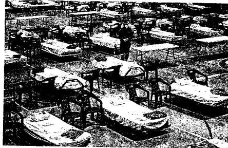
①スペイン北東部バルセロナ近郊の臨時病院で、ベッドの準備をする赤十字職員＝EPA・時事 ②臨時休業を知らせる居酒屋の張り紙＝8日夜、東京都千代田区で