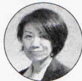
とことん共産党司会者