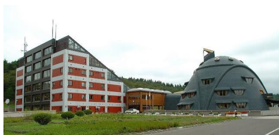
(東通村役場と交流センター)

原発マネー依存症になると、新しい原発を作り続けないとお金が不足する。今年度は東京電力や東北電力などにおねだりをして 6 億円の寄附を予定して、何とか予算が組めた状況だ。原発マネーで拡大した財布は、すぐにダウンサイジングはできずに、「ほら貝に入ったヤドカリ状態」は続く。