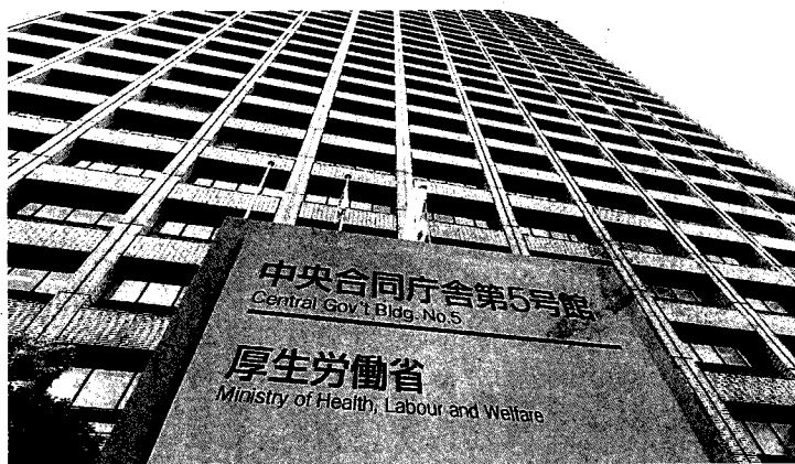
中央合同庁舎第5号館 厚生労働省 Ministry of Health, Labour and Welfare

①厚生労働省が入る中央合同庁舎第5号館＝東京・霞が関で ②郵便局に搬入された政府が配布する布マスク＝東京都世田谷区で